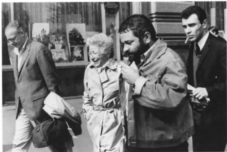
С Мэри Хемингуэй. Москва. 1969 г.