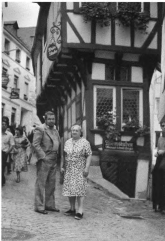
С Жоржем Сименоном. Лозанна, 1981 г.