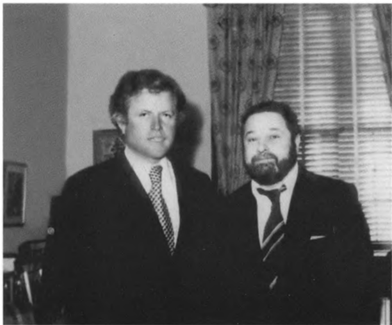
С Эдвардом Кеннеди. США. 1970-е гг.