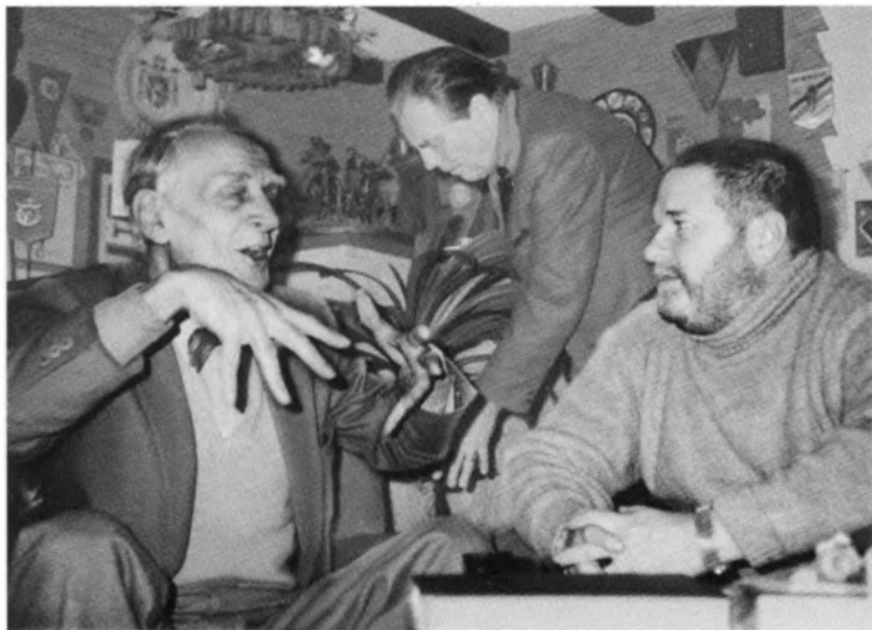
С Федором Федоровичем Шаляпиным и бароном Эдуардом Фальц-Фейном. Лихтенштейн. 1982 г.