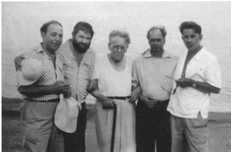
С писателями. В центре С. А. Маршак. 1961 г.