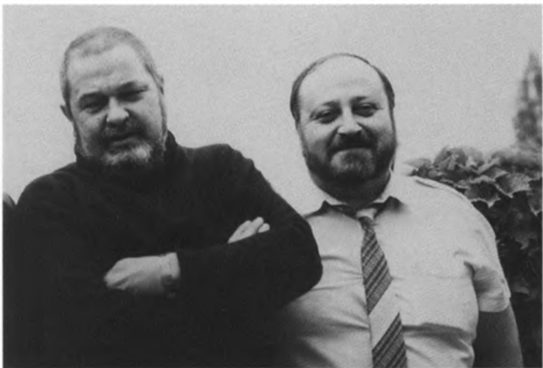
С Георгием Вайнером.