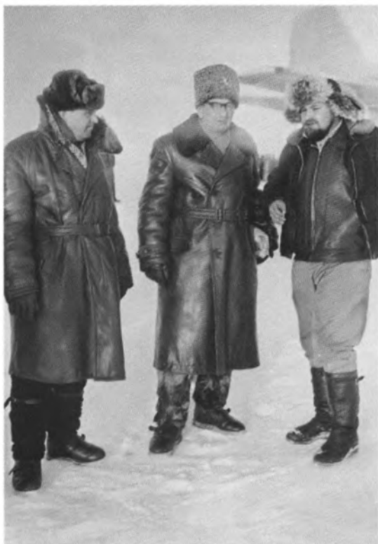
На Северном полюсе. Крайний справа Юлиан Семенов. 1960-е гг.