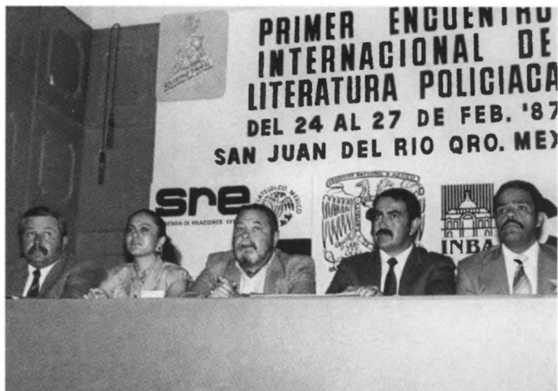
На съезде писателей детективной литературы. 1987 г.