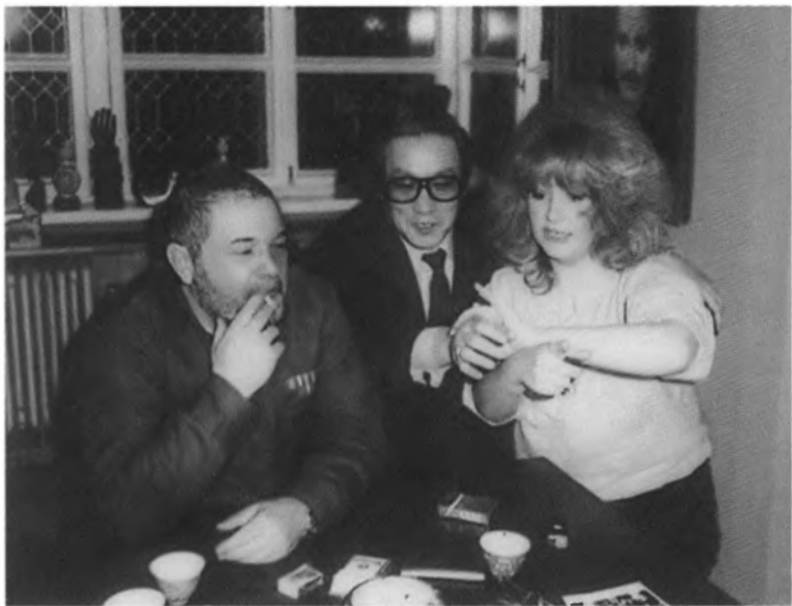
С Аллой Пугачевой. Москва. 1980-е гг.