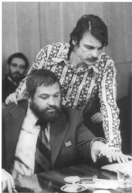
С Андреем Тарковским. 1970-е гг.