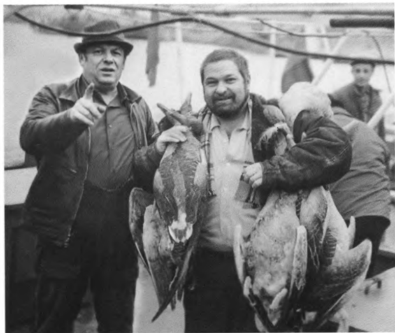
На охоте. 1970-е гг.