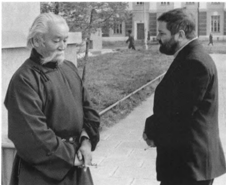
С буддийским монахом. Монголия. 1960-е гг.