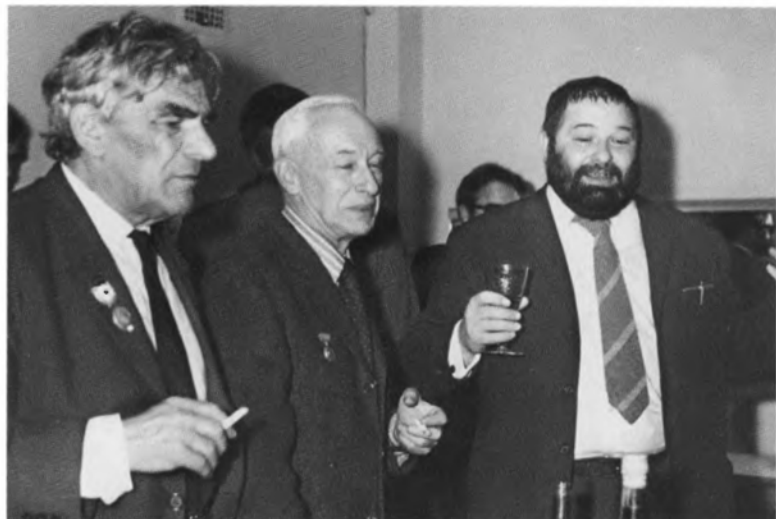
С Романом Карменом (в центре). 1970-е гг.