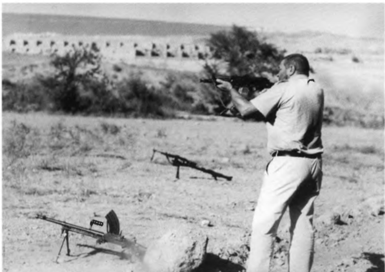
В Афганистане. 1985 г.