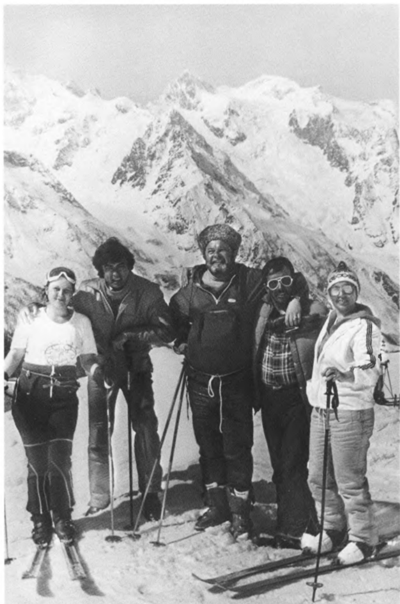
С друзьями в горах. Домбай. 1983 г.