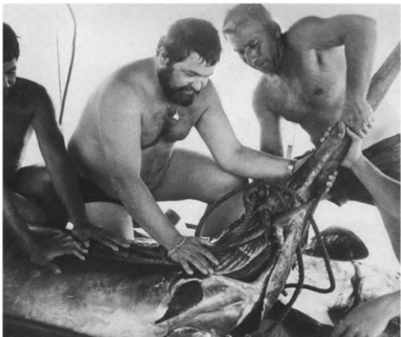
Поймана рыба-пила. Куба. 1976 г.