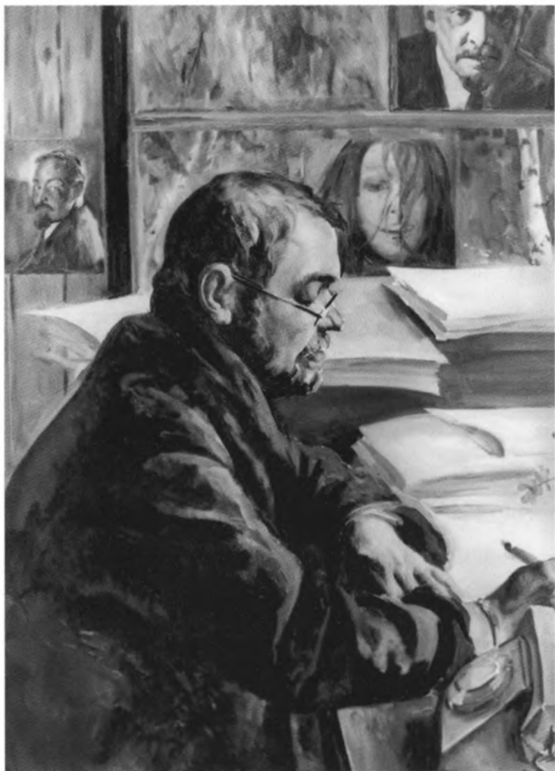
Юлиан Семенов. С картины Дарьи Семеновой.