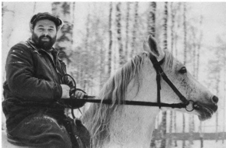
В странствиях по тайге. 1960 г.