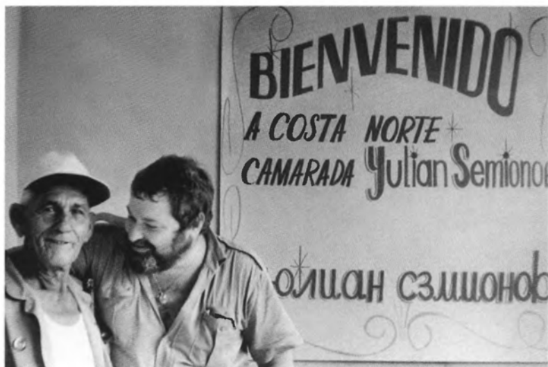
С Грегорио — другом Хемингуэя. Куба. 1976 г.