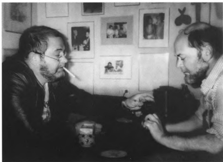
Юлиан Семенов и Лев Аннинский. Мухоматка. 1983 г.