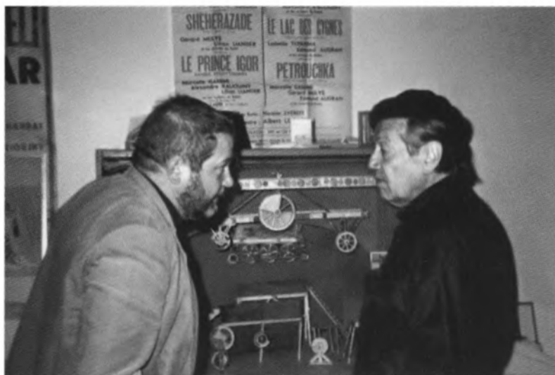
С Сергеем Лифарем. Париж. 1981 г.