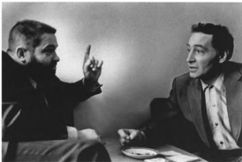
Работа с Вячеславом Тихоновым над фильмом «Семнадцать мгновений весны».