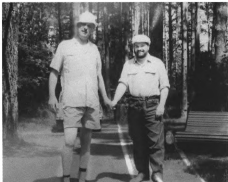
С Сергеем Владимировичем Михалковым. Николина Гора . 1954 г.